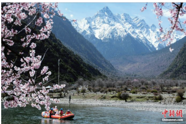
2023年阿依舍·中国漂流联赛(西藏工布江达县站)的比赛在此间举行。