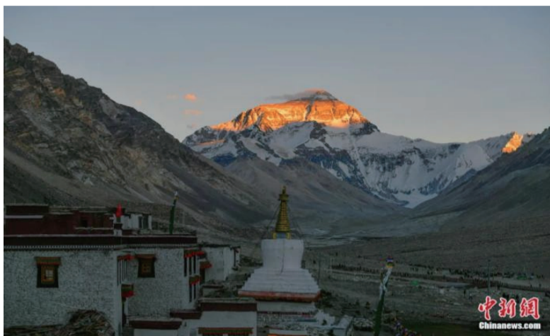
位于西藏日喀则市定日县的世界第一高峰珠穆朗玛峰显露出“日照金山”的美景。