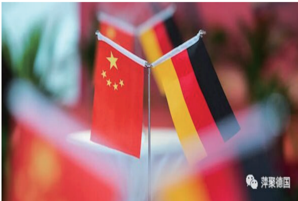
德国最重要的贸易伙伴

同时，美国在全球抗疫中发挥了很大的破坏性作用。本来抗疫是全社会、全世界的事情，但是美国首先把抗疫政治化，这是很不应该的一件事情。（中新网微信公众号）