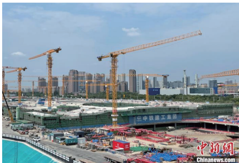
“高质量发展调研行”北京主题采访活动7月11日走进北京城市副中心站综合交通枢纽项目。该项目预计2025年投入使用。建成后，将是亚洲最大的地下综合交通枢纽。中新社记者 杜燕 摄

京城市副中心综合枢纽公司副总经理张登科介绍，项目内设置京唐城际和城际铁路联络线，建成后15分钟到达首都机场、35分钟到达大兴国际机场及河北唐山、1小时内到达天津滨海新区及河北雄安新区，为京津冀协同发展提供现代化的交通支撑。