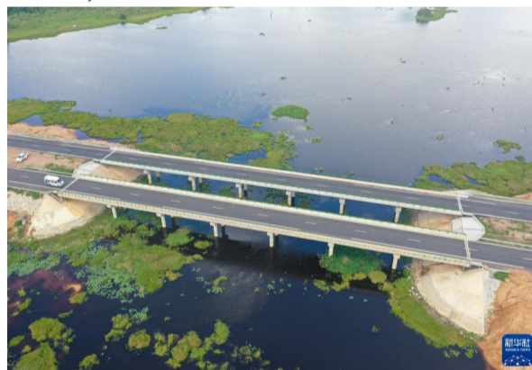
这是6月13日在科特迪瓦布瓦凯拍摄的铁布高速公路（无人机照片）。