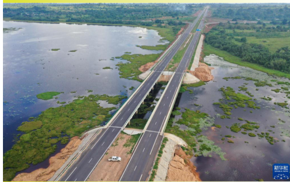
这是6月13日在科特迪瓦布瓦凯拍摄的铁布高速公路（无人机照片）。