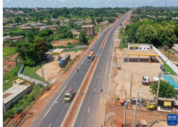
这是6月13日在科特迪瓦布瓦凯拍摄的铁布高速公路（无人机照片）。