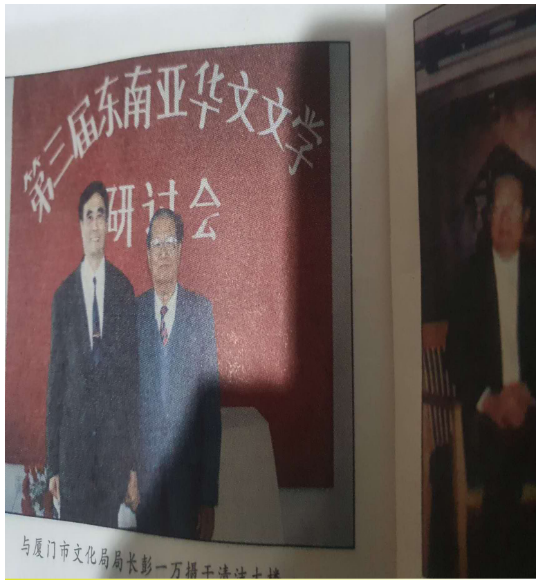
与厦门市文化局长彭一万合影

斗,孜孜不倦为宏扬中华文化作出积极贡献,我们为此向他致以崇高的敬意和祝福,祝福他长寿幸福,为印华文学继续创作,为中华文化作出杰出的贡献。(李全)