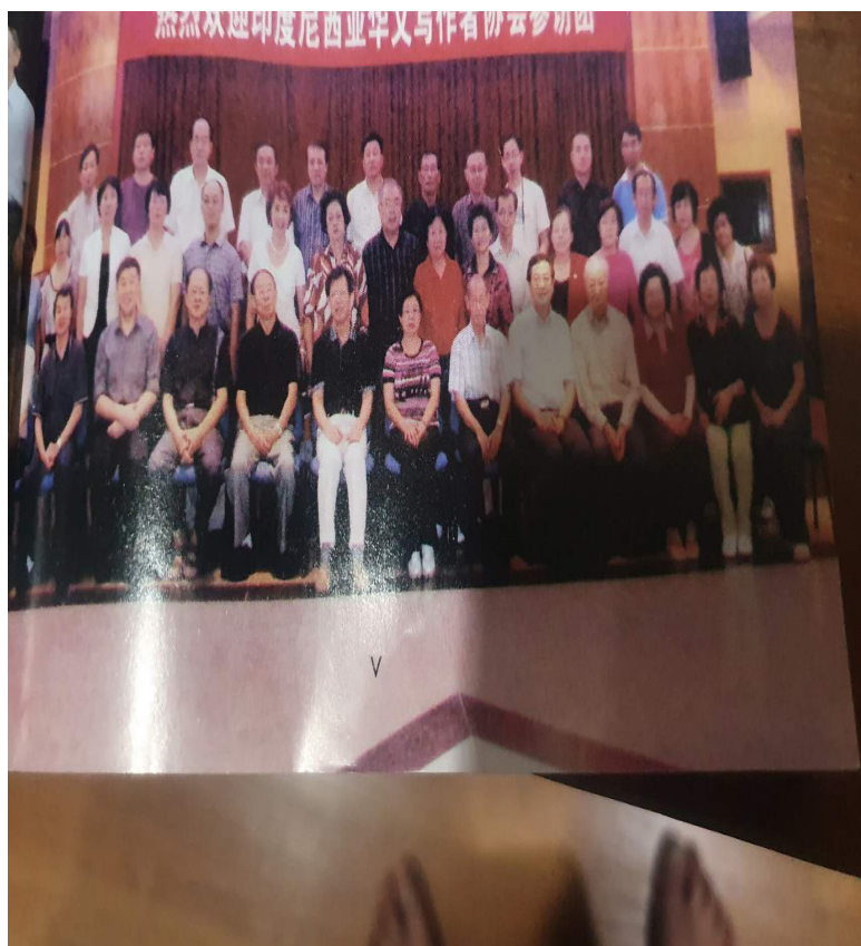
印尼代表团访问国外合影