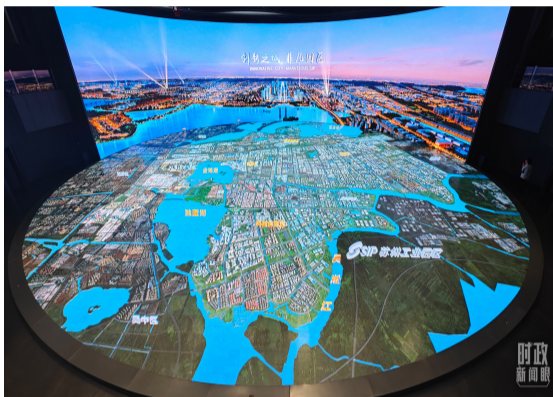
△ 苏州工业园区数字沙盘。