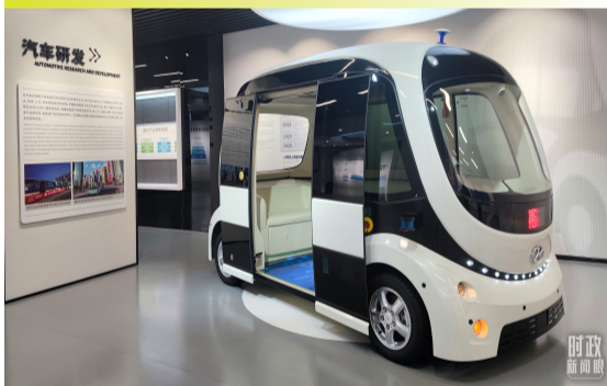
△ 苏州工业园区企业研发的无人驾驶汽车。