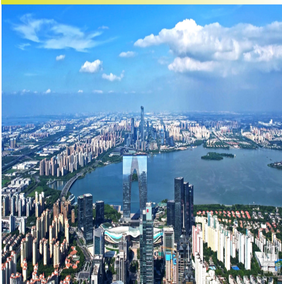
△ 苏州工业园航拍。