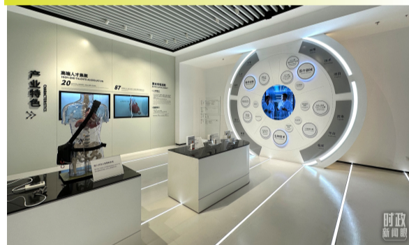
△ 园区展示中心的生物医药产业创新展示。