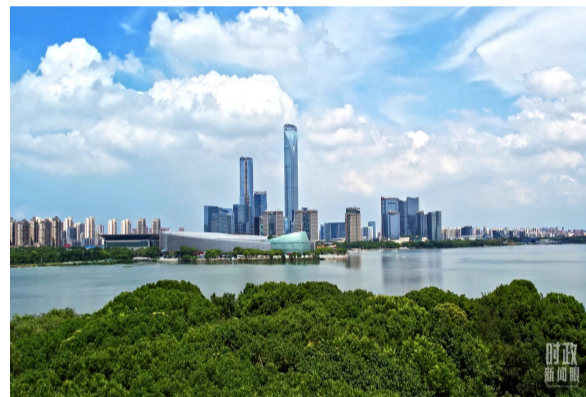
△ 金鸡湖畔的苏州工业园区。