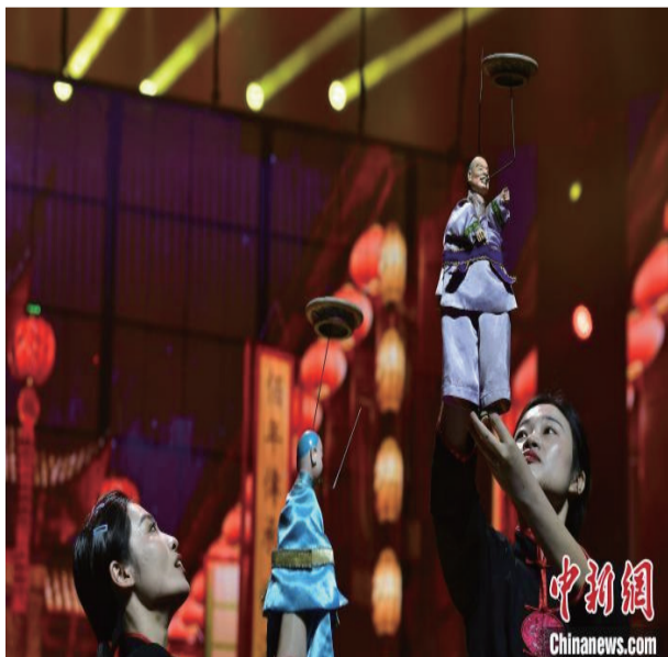
图为泉州市提线木偶戏传承保护中心和晋江市掌中木偶艺术保护传承中心的演员表演木偶戏《闹元宵》。