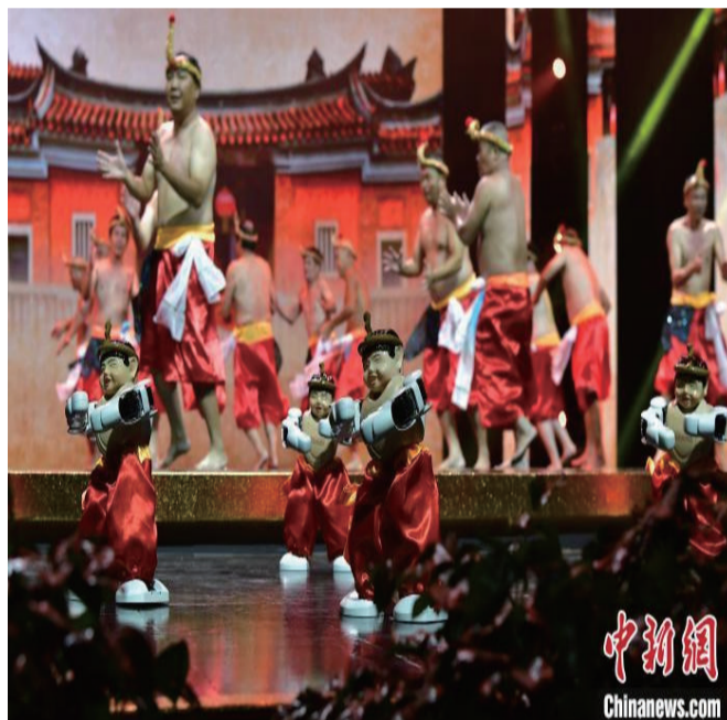
图为晚会上泉州市鲤城区王宫拍胸舞队和机器人同台表演闽南民间文化“活化石”——拍胸舞。