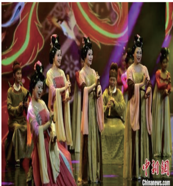
图为来自泉州南音乐团和泉州艺术学校的演员在世遗之夜晚会上表演南音《百鸟归巢》。