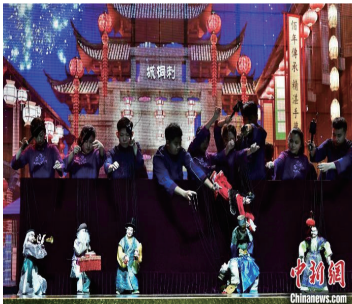
图为来泉州市提线木偶戏传承保护中心和晋江市掌中木偶艺术保护传承中心的演员表演木偶戏《闹元宵》。