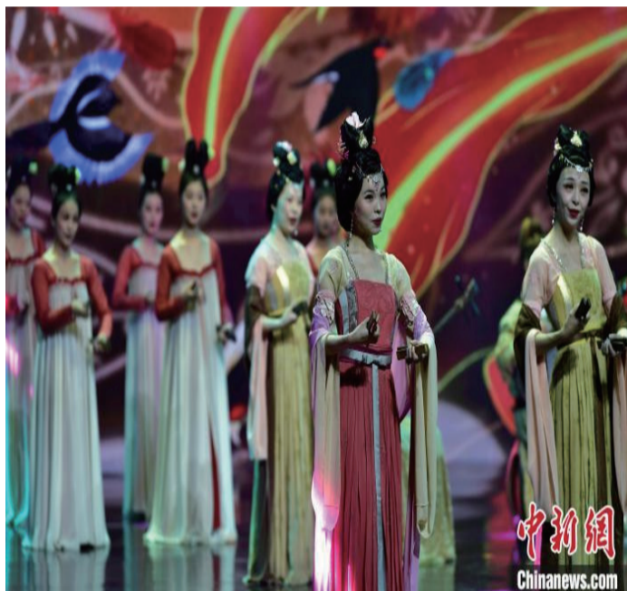
图为南音表演唱《百鸟归巢》。被列入《人类非物质文化遗产代表作名录》的南音，是中国四大古乐之一。