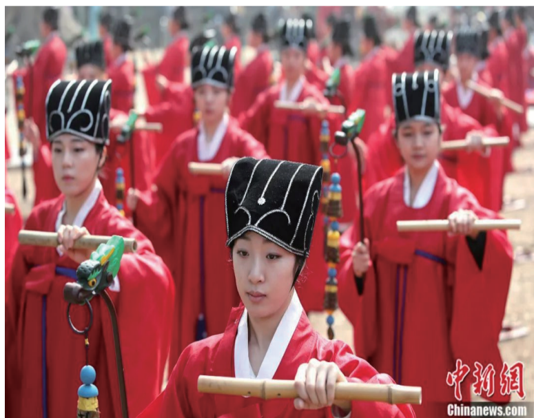
纪念大成至圣先师孔子的春季释奠礼在韩国成均馆大成殿前举办。在古代，祭孔活动被称为“释奠礼”。

在治理维度，倡导有效市场和有为政府。儒家经济圈内国家/地区实行相对集权、重视政府作用的发展模式。这种既利