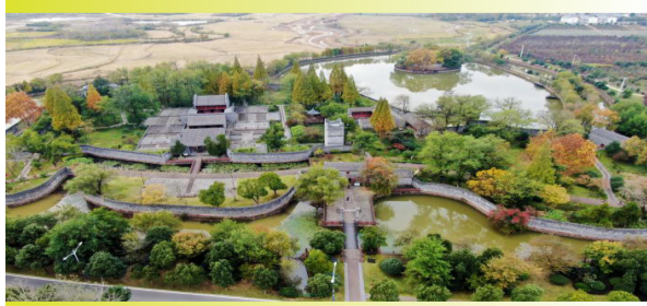
安徽省肥西县刘铭传故居。