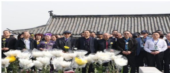
2023海峡两岸祭拜刘铭传活动在安徽合肥刘铭传墓园举行，来自海峡两岸的200余位各界人士参加。