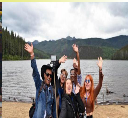
图为多国“Z世代”青年在普达措国家公园游览。