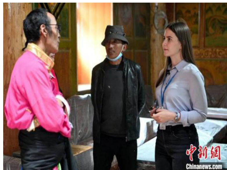
图为“Z世代”青年了解、体验藏族传统民居。