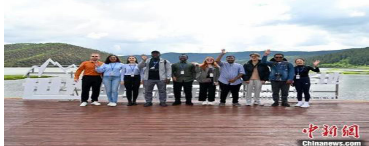
图为多国“Z世代”青年在普达措国家公园游览。