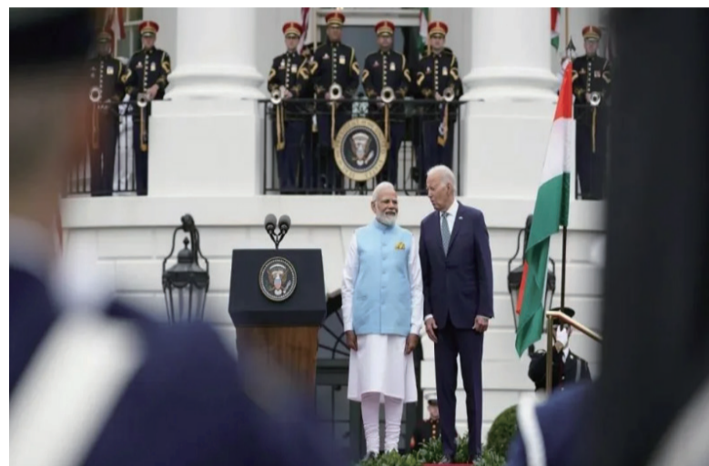
6月22日，印度总理莫迪抵达美国，开启了为期4天的访美之旅。

第一，分析家们过去一直错误地判断了印度的崛起。早在上世纪90年代，他们就鼓吹着快速增长且年轻的人口将会推动印度经济自由化，创造一个“经济奇迹”。美国最资深的印度分析专家之一，