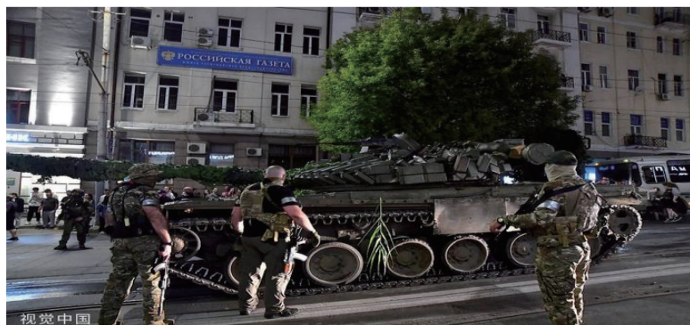
当地时间2023年6月24日，俄罗斯罗斯托夫，瓦格纳集团的成员准备离开南部军区总部，返回他们在顿河畔罗斯托夫的基地。

托夫的俄南部军区总部，随后在当日晚间宣布，为避免流血冲突，停止在俄境内行进并返回野战营地。26日晚，俄总统普京表示，瓦格纳战士将有机会与俄国防部或者其他强力部门签署合同，继续为俄罗斯效力，或者返回故乡，如果有意愿，也可以前往白俄罗斯。