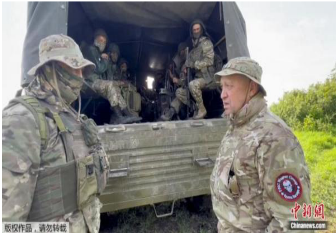
资料图：2023年6月，普里戈任在前线与瓦格纳集团士兵交谈。