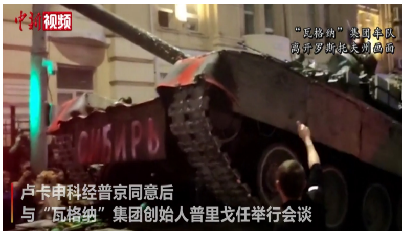
卢卡申科经普京同意后与“瓦格纳”集团创始人普里戈任举行会谈