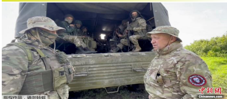
2023年6月，普里戈任在前线与瓦格纳集团士兵交谈。