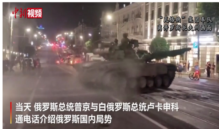
当天 俄罗斯总统普京与白俄罗斯总统卢卡申科通电话介绍俄罗斯国内局势