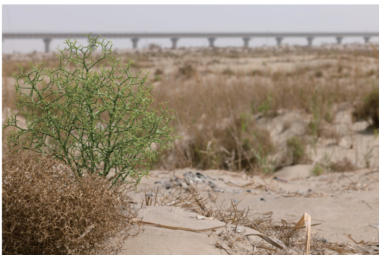
这是2022年5月19日拍摄的和若铁路沿线种植的耐旱植物。