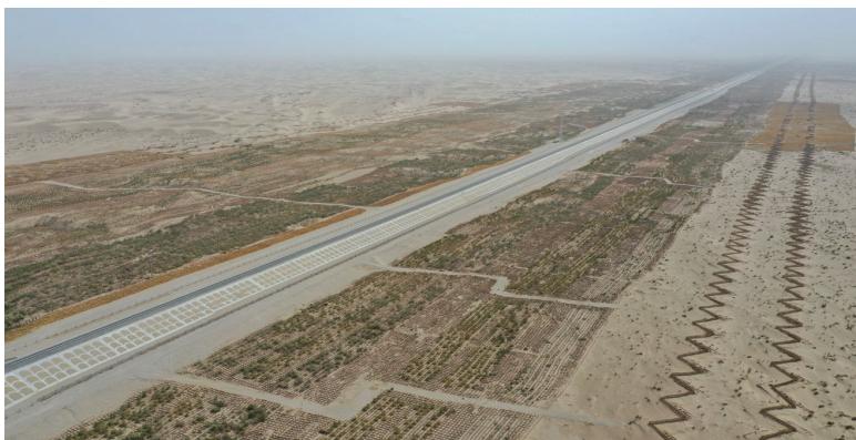
这是在和若铁路沿线拍摄的芦苇沙障、芦苇方格和耐旱植物组成的防沙“三件套”（2022年5月19日摄，无人机照片）。