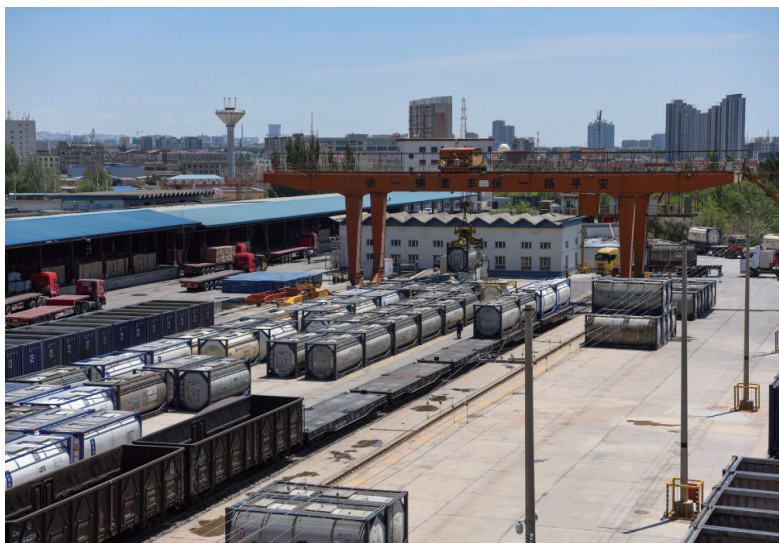
在新疆库尔勒铁路货场，工作人员操作龙门吊进行装车作业（5月30日摄）。