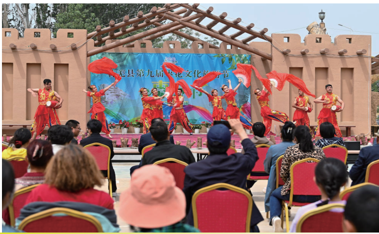
在新疆若羌县瓦石峡镇，若羌县楼兰艺术团的演员为参加枣花节的游客表演歌舞（5月28日摄）。