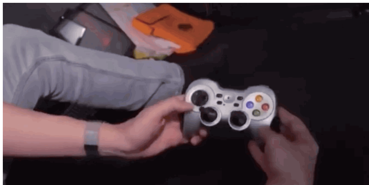
网传图片指「泰坦号」的操作只靠一个二百多元的游戏控制器。社交媒体