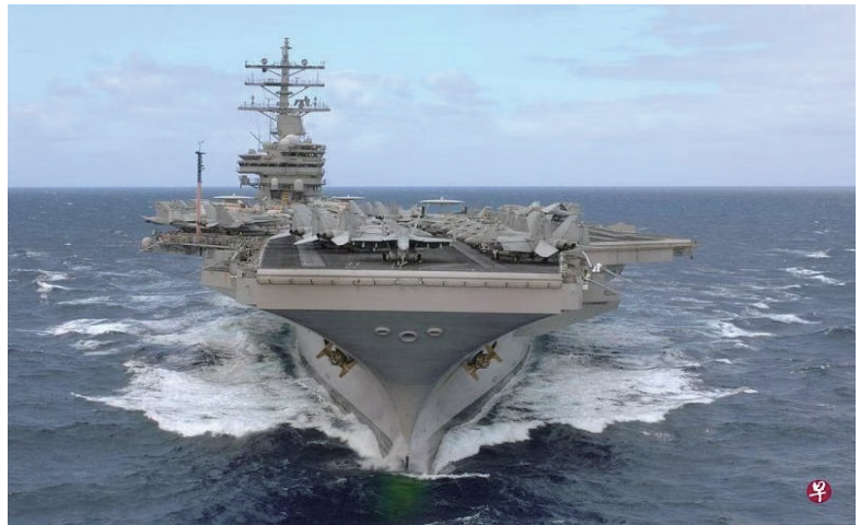
美国罗纳德·里根号为美国海军尼米兹级核动力航空母舰的九号舰。 (档案照)