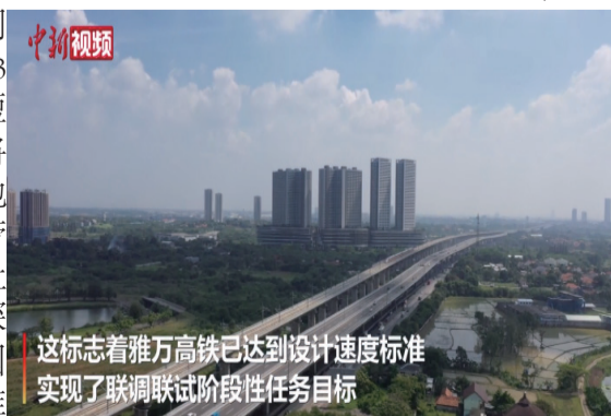
这标志着雅万高铁已达到设计速度标准实现了联调联试阶段性任务目标

动共建“一带一路”高质量发展和印尼“全球海洋支点”战略的实施，具有十分重要的意义。(中新