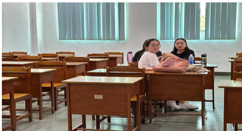
亚洲友好学院学生课后还在研讨