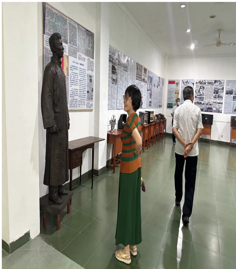
在苏北华人文史馆，见到郁达夫先烈铜像。(南京侨联专送)