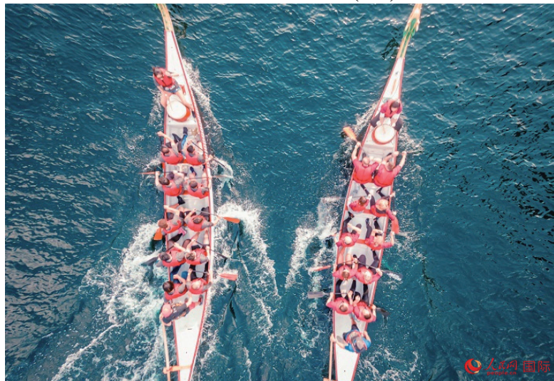
龙舟活动现场。