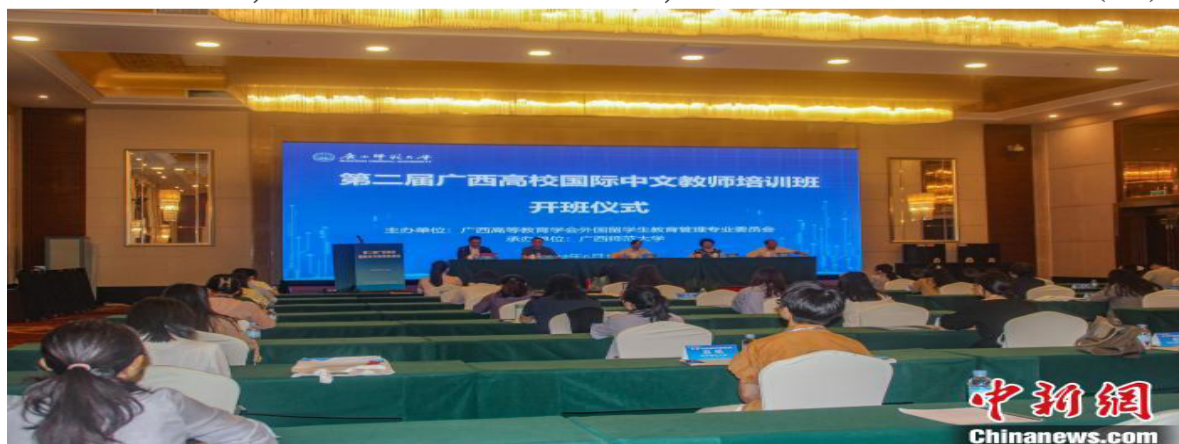
培训班开班仪式现场。

据悉，本次培训班由广西高等教育学会外国留学生教育管理专业委员会主办，广西师范大学承办，来自广西各高校的近50名国际中文教师参加了此次培训。(完)