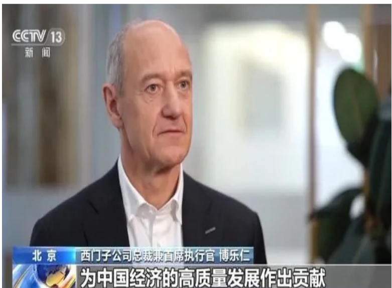
博乐仁接受央视专访