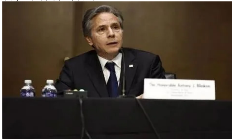
布林肯此次访华，见不到李强总理