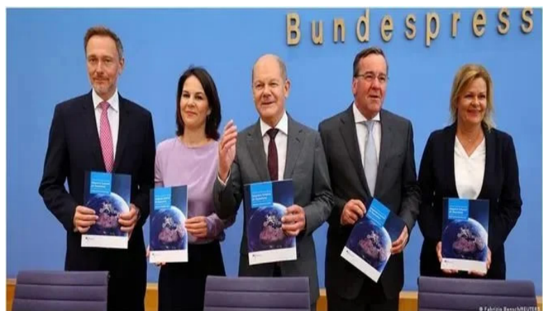
朔尔茨与四位内阁成员介绍德国的首份国家安全战略

就在中国宣布相关外交行程之前，德国总理朔尔茨刚于6月14日宣布了首份国家安全战略。在该份战略里，朔尔茨称中国是德国的合作伙伴，也是竞争者，更是制度性对手，且近年来，对抗和竞争的因素在增加。