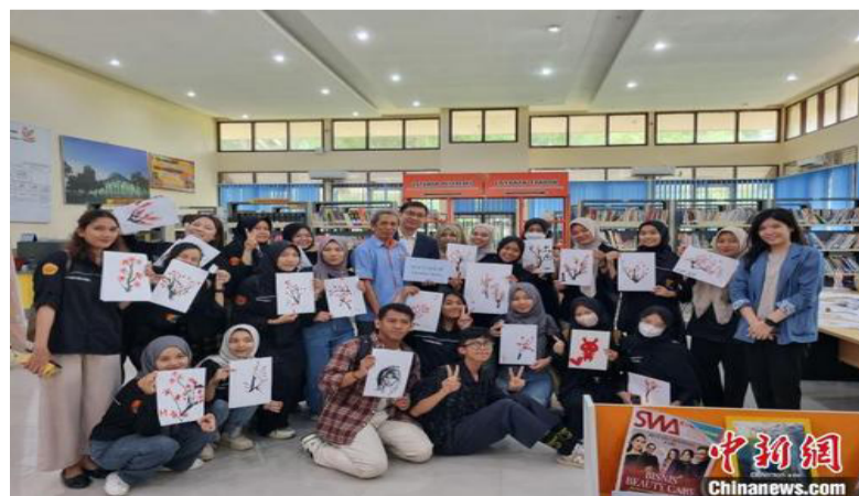
占碑大学的学生们展示作品。