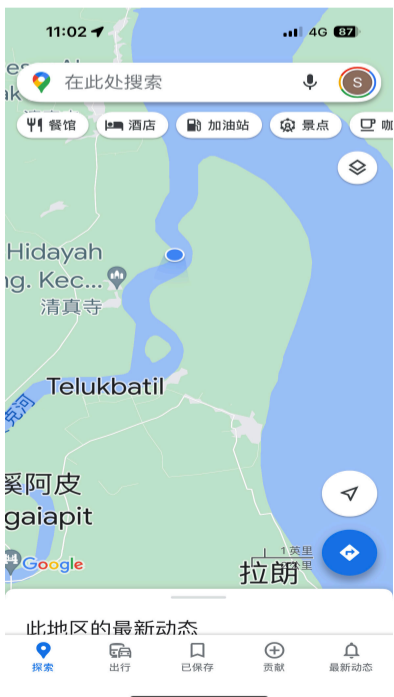
这是内陆河，我们乘船逆流而上北干

望加丽岛面积11482平方公里，现有人口约70多万人。在1942年荷兰统治时代，当地大部分是山芭和原始森林，景色优美壮丽，被郁达夫等称为“乱世桃源”，因此，郁达夫写下许多诗歌，后来收集成残缺不全的“乱离杂诗”11首，是郁达夫最后的佳作部分，其中第九首在岛上彭鹤岭作的七律如下：