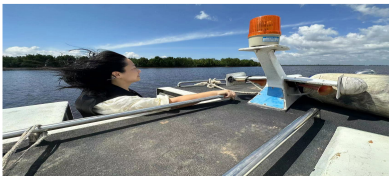
在西亚河逆流而上，相当凉爽。