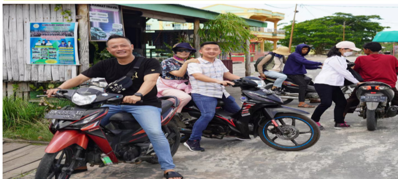
在保东村乘塔摩托车出行