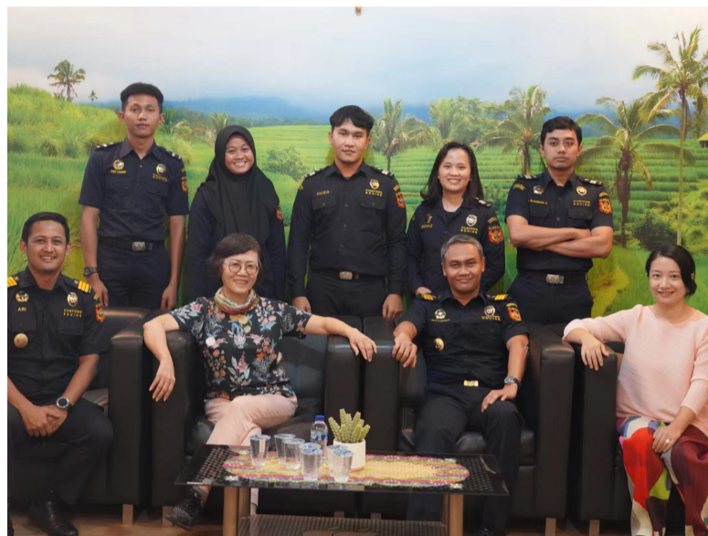
望加丽海关与相关官员合影