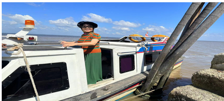
登上前往北干的客船。