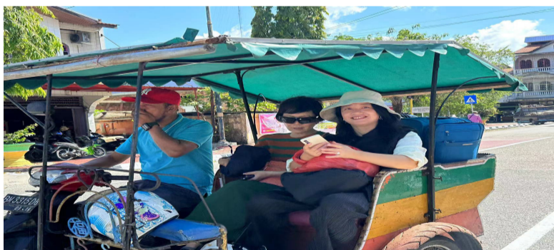
再乘搭摩托车前往码头，乘船前往北干巴鲁市