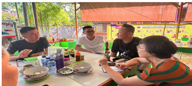
当地两位年轻企业家热情协助，突显印华年轻一代前途光明。