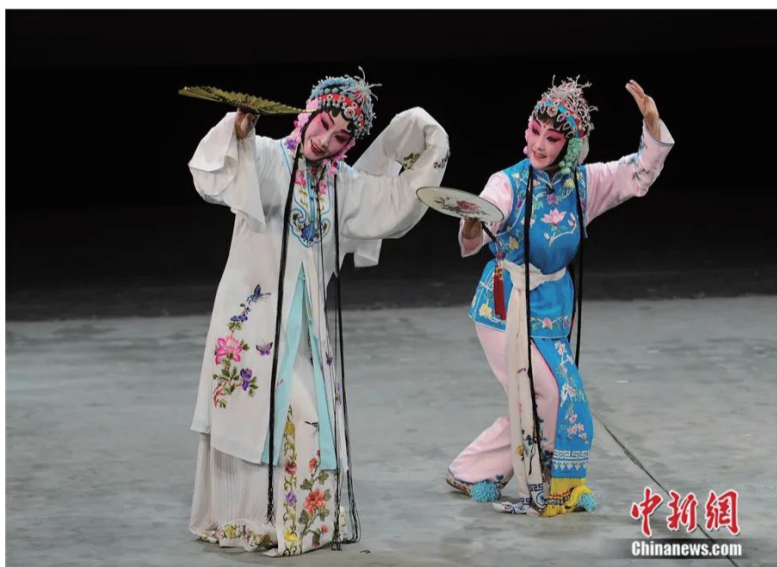
湖南郴州，昆曲表演者正在表演天香版《牡丹亭》。