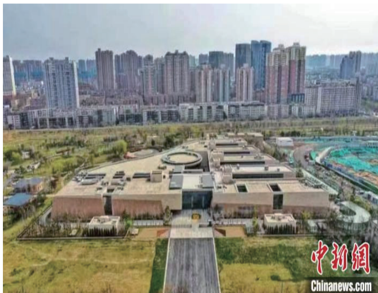
航拍郑州商城国家考古遗址公园。

保护成果显现，使群众享受到文化遗址保护的成果、感受到考古对现实生活的意义。2022年12月，郑州商城考古遗址公园正式进入国家级考古遗址公园的序列。（完）