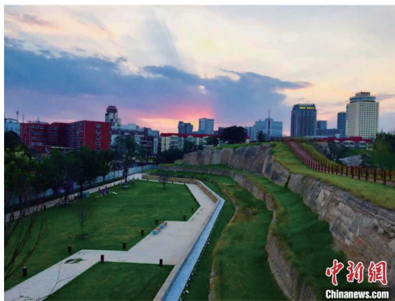
图为郑州商城国家考古遗址公园的城墙遗址。