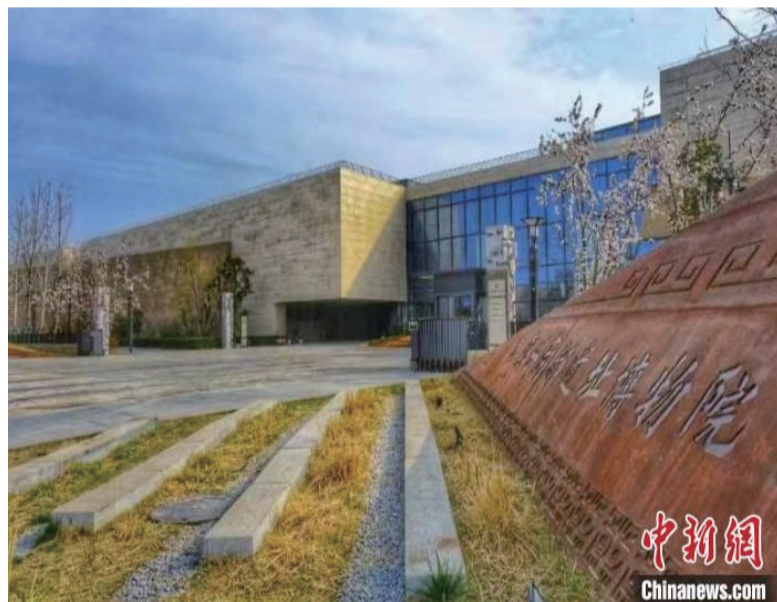
图为郑州商代都城遗址博物院。