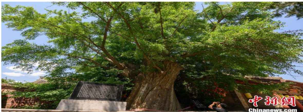
据树旁碑文记载，这棵银杏树高25.4米，胸径3.25米。

6月9日，山西省晋城市泽州县，游客在古村落冶底村参观古银杏树。据树旁碑文记载，这棵银杏树高25.4米，胸径3.25米，树龄大约为6200年。当地村民介绍说，这棵古树需要8个人才能将其合抱。