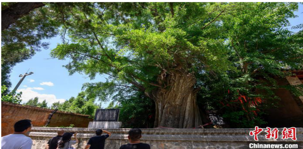
游客在古村落冶底村参观古银杏树。