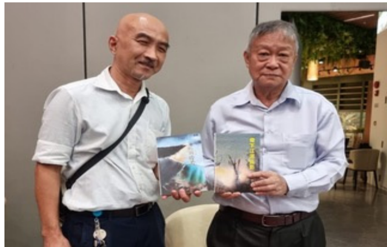
听讲座，不忘购书支持