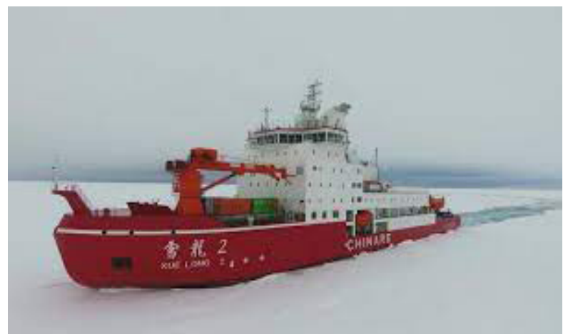
“雪龙2”号正在进行首向破冰试验