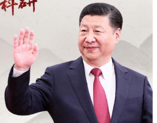
中国国家主席习近平