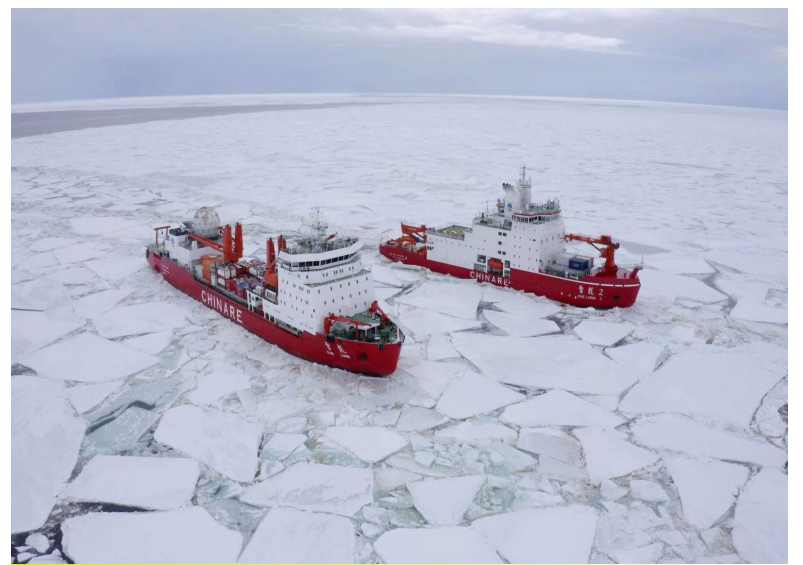
正在执行中国第36次南极考察任务的“雪龙”号（左）和“雪龙2”号（右）