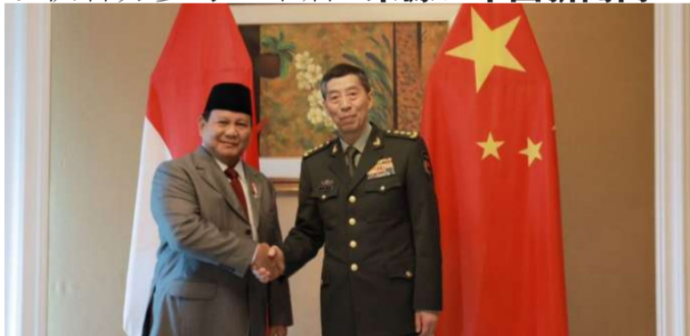
印尼国防部长帕拉波沃·苏比安多在新加坡香格里拉大酒店与中国国防部长李尚福举行双边会谈。