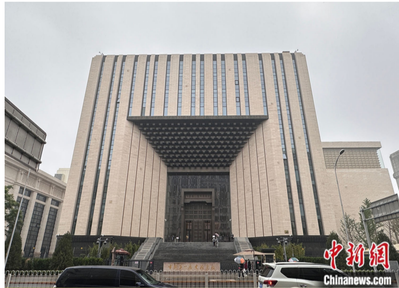
中国第一历史档案馆新馆。