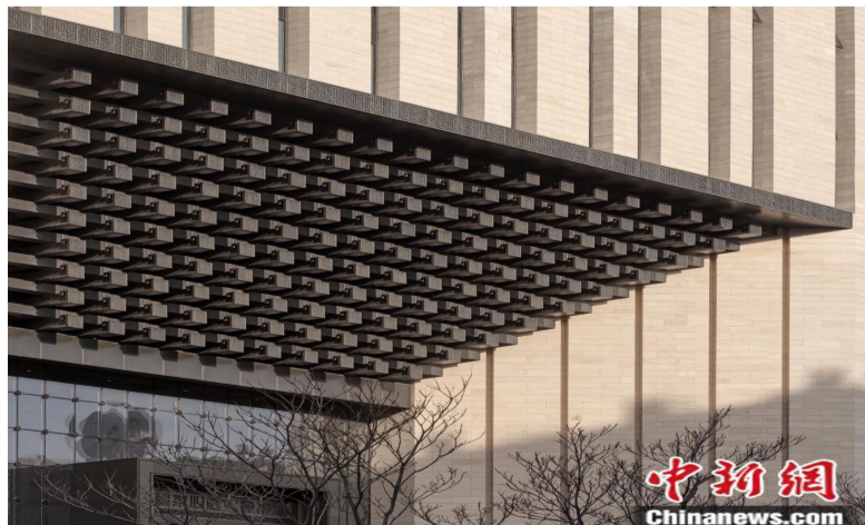
中国第一历史档案馆新馆主入口上斗拱。