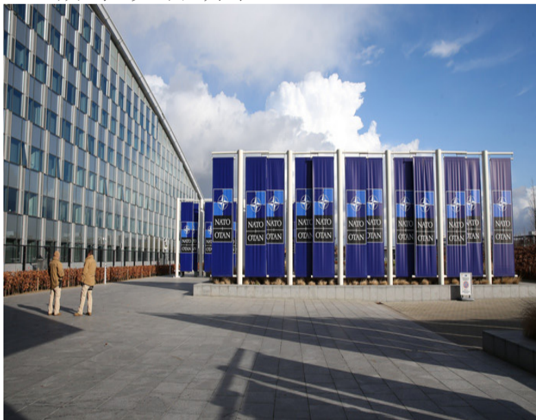
第二届欧洲政治共同体领导人会议现场