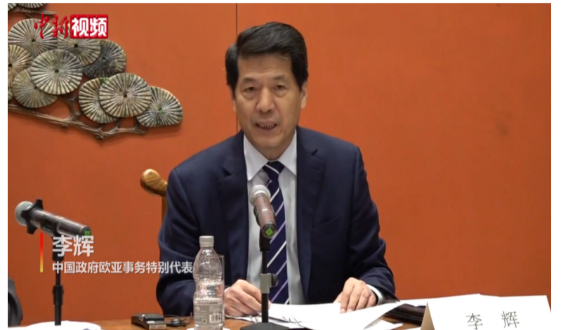
中国政府欧亚事务特别代表：李辉