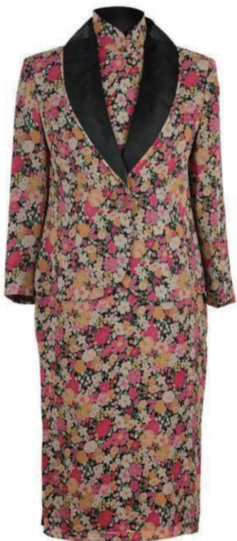
旗袍套装。

海派旗袍可以被视作近代中国服饰变革的起点和启蒙。旗袍最初的流行，一定程度上受到西方同时