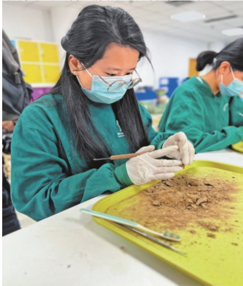
5月13日，学生在郑州大学历史学院人骨考古实验室进行研究工作。

工欲善其事，必先利其器。中华文明探源工程秉持多学科、多角度、全方位的理念，通过多学科的研究，利用各种各样的自然科学手段和