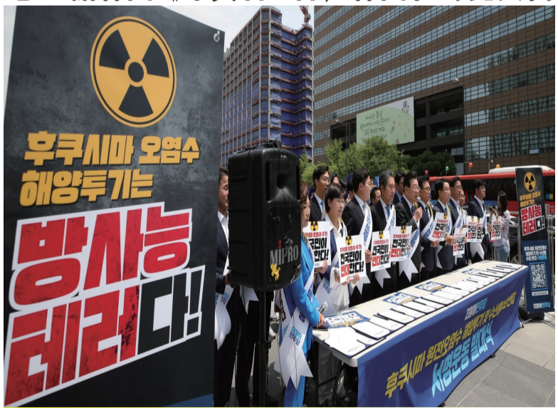
韩国共同民主党在首尔举行反对日本核污水排海签名活动的启动仪式。

报》29日报道,28日电 据韩国《中央日,韩国在野党共同民主党在位于首尔的国会大厦前拉开横幅,称“核污水排海是核能恐袭行为”。他们还在首尔各地打出标语牌,表示韩国5000万人都反对进口福岛核食品。