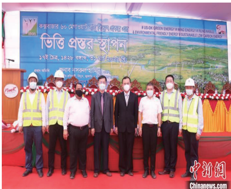
资料图为孟加拉国科巴风电项目开工奠基。