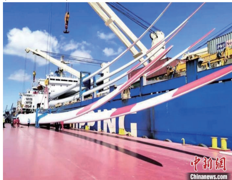
孟加拉国科巴风电项目风机集港发运。