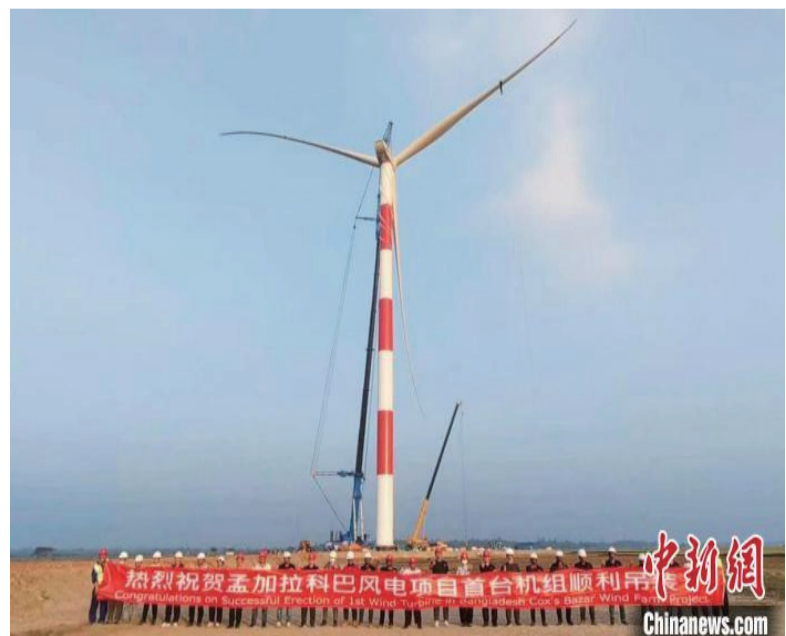
孟加拉国科巴风电项目首台机组吊装完成。