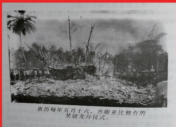
农历每年五月十六，峇眼亚比独有的焚烧龙舟仪式。