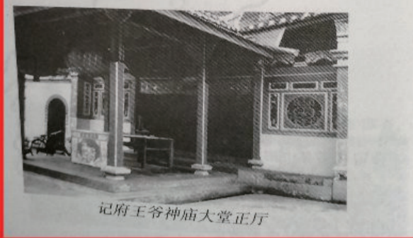
记府王爷神庙大堂正厅