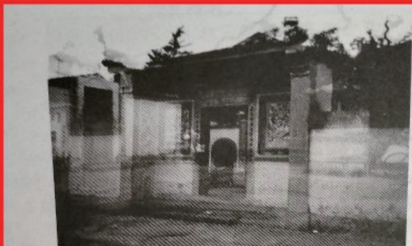
峇眼亚比“记府王爷”神庙已有几百年历史，每年农历五月十六日在这里举行隆重别致的焚烧龙舟的“谢恩”大典。