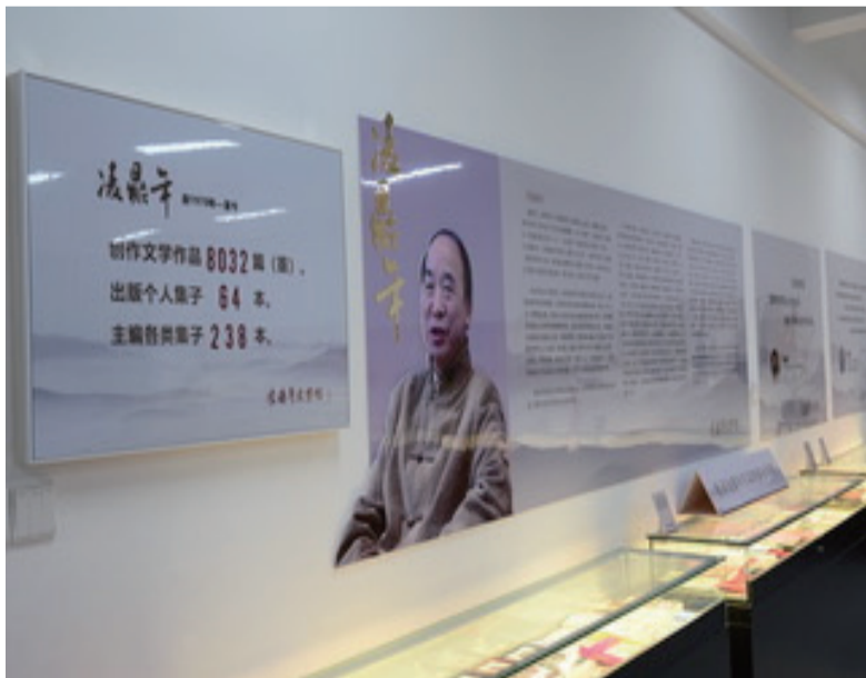
凌鼎年文学馆三楼展厅一角