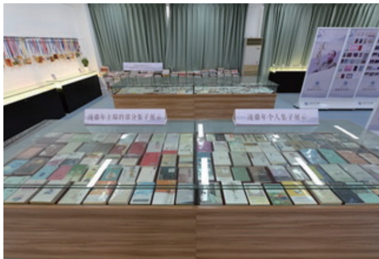
凌鼎年出版的个人集子与主编集子展示