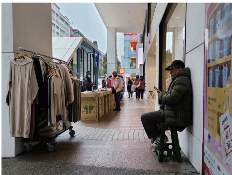
民进党当局执政7年来经济下滑，引发岛内多方批评。

台湾《联合报》20日的社论指出，台湾经济因“新南向政策”一事无成；能源转型政策固执不化，为台湾埋下供电不足隐忧，近半年出口及工业生产持续翻黑均是恶兆；台湾的社会秩序因枪支、毒品泛滥而变得