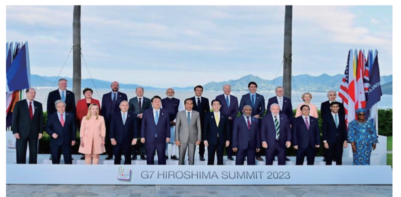
佐科威总统在广岛与G7等领导人合影