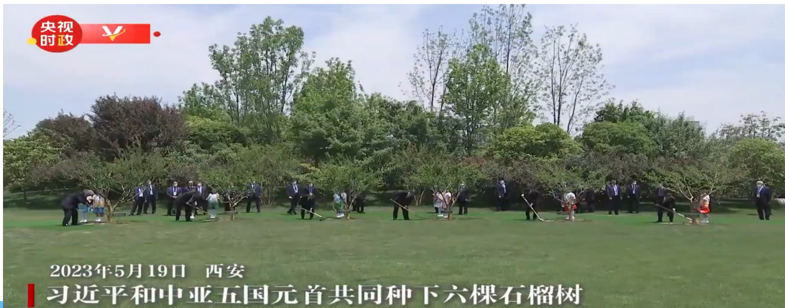
2023年5月19日 西安 习近平和中亚五国元首共同种下六棵石榴树

2023年5月19日，中国-中亚峰会结束后，习近平和中亚五国元首共同种下六棵石榴树，既见证中国同中亚千年友好交往，也象征中国同中亚紧密团结合作，更寄托对中国-中亚关系美好未来的期待。