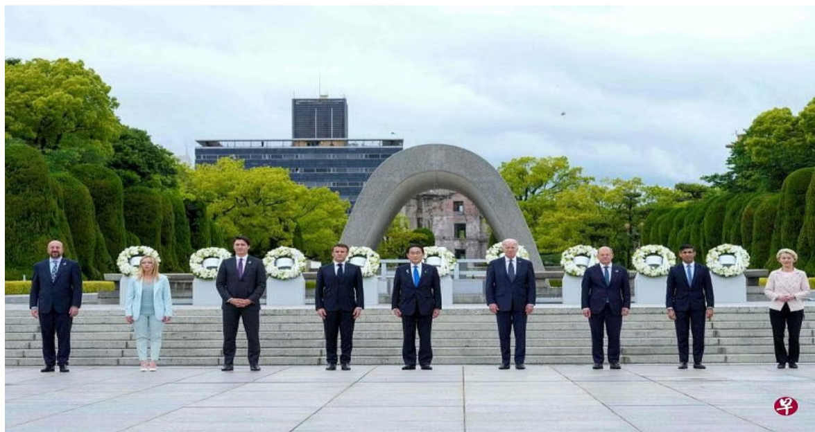
(左二起)意大利总理梅洛尼、加拿大总理特鲁多、法国总统马克龙、日本首相岸田文雄、美国总统拜登、德国总理朔尔茨、英国首相苏纳克在参观了原子弹博物馆后,在和平广场上献花。欧洲理事会主席米歇尔(左一)和欧盟主席冯德莱恩(右一)也出席了仪式。