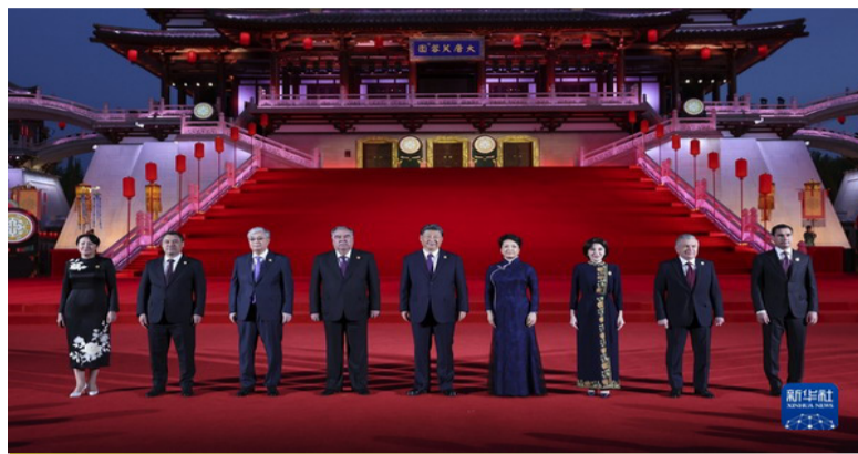
2023年5月18日晚,中国国家主席习近平和夫人彭丽媛在陕西省西安市大唐芙蓉园为出席中国—中亚峰会的中亚国家元首夫妇举行欢迎仪式和欢迎宴会。