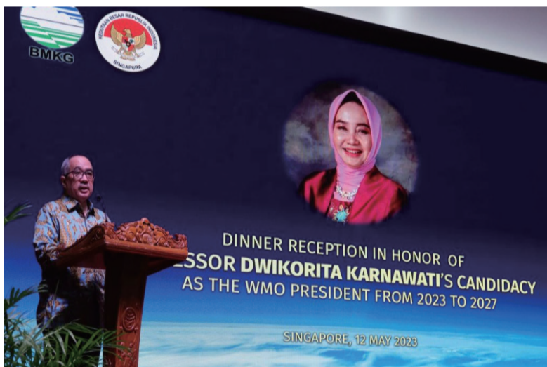
印尼驻新加坡大使Suryo Pratomo介绍丽塔教授成为世气组织主席候选人