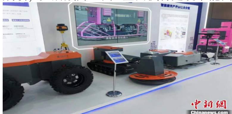
第十九届国际绿建大会15日在沈阳启幕。