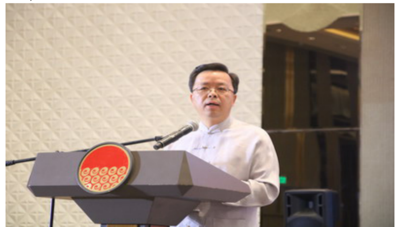
中国驻菲律宾大使黄溪连