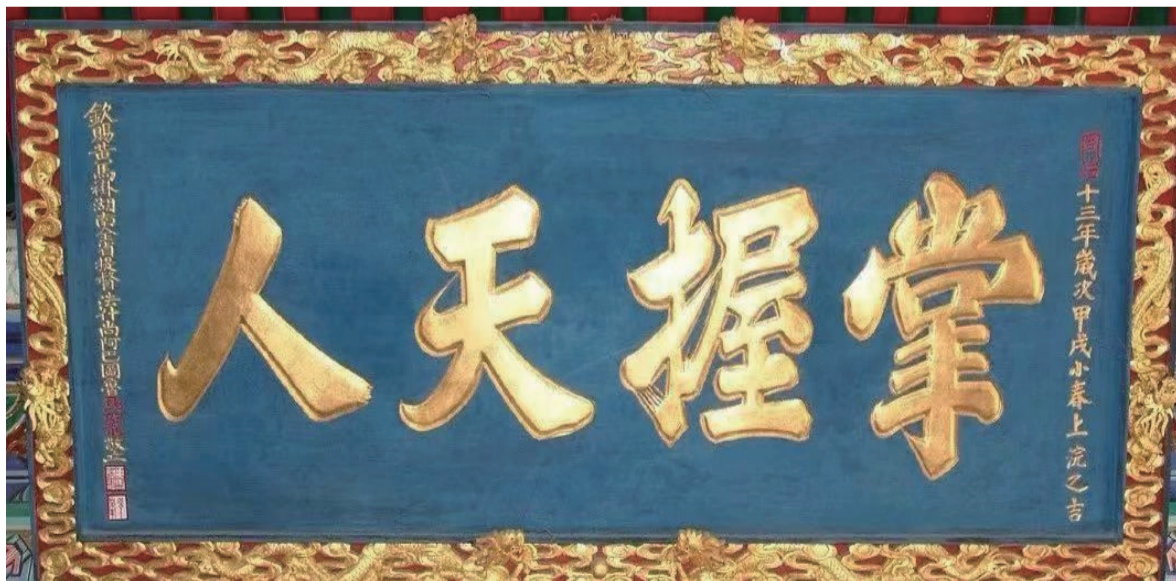
牛街礼拜寺清同治十三年抱厦匾：掌握天人。