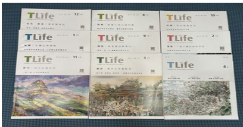
《TLife》每期都有“搭高铁游台湾”专题