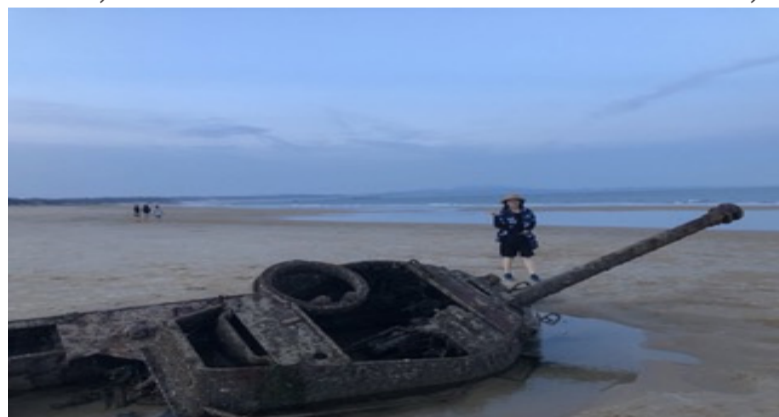
欧厝海滩“沉睡战车”是金门打卡热点