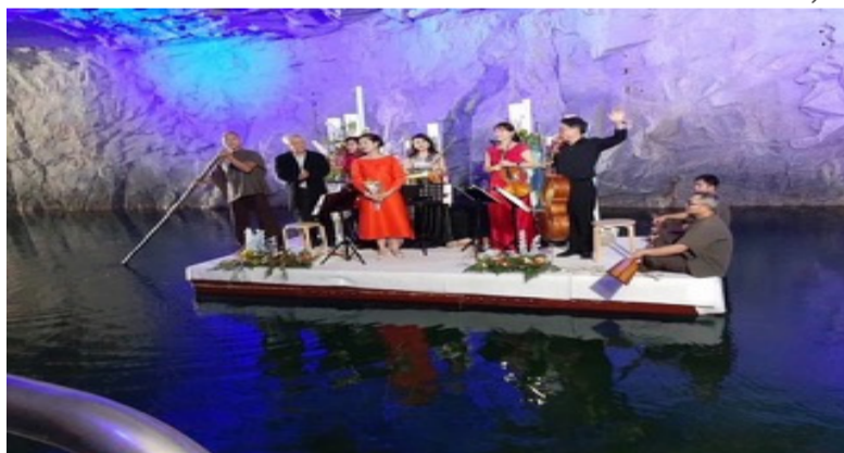
每年一开卖就秒杀的“金门坑道音乐节”