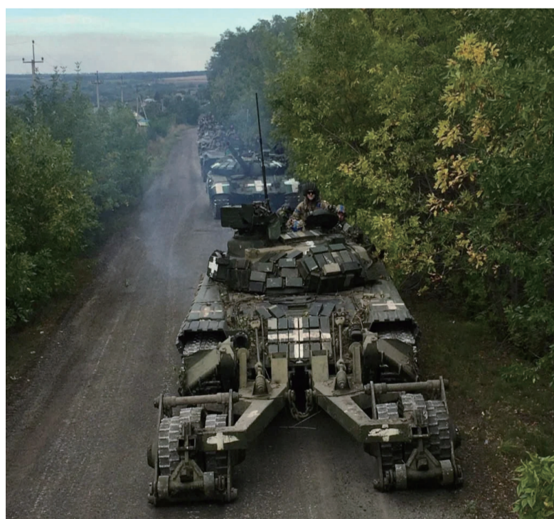
乌军正在积蓄反攻力量