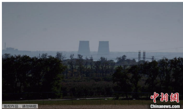
资料图：从远处看到的扎波罗热核电站。